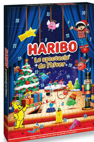
25.95 HARIBO ADVENTSKALENDER 310 g (100 g = 8.38)