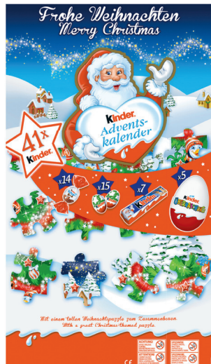
16.95 KINDER MAXI-MIX ADVENTSKALENDER 311 g (100 g = 5.46)