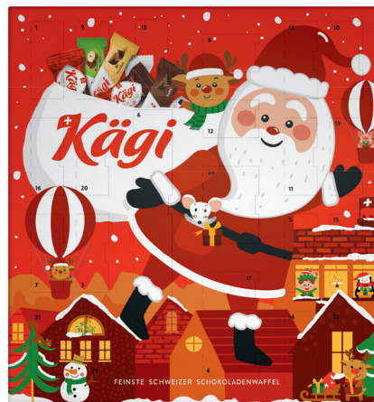
15.95 KÄGI ADVENTSKALENDER 200 g (100 g = 7.98)