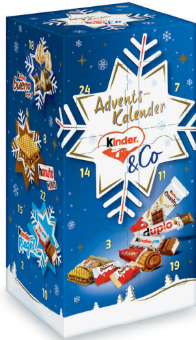
12.95 FERRERO KINDER HAPPY SNACK ADVENTSKALENDER 295 g (100 g = 4.39)