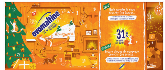
18.95 OVOMALTINE ADVENTSKALENDER 268 g (100 g = 7.08)