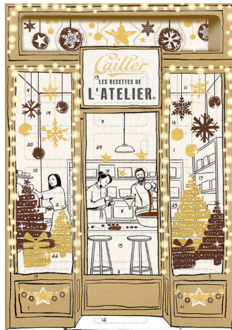
15.95 CAILLER ADVENTSKALENDER LES RECETTES DE L'ATELIER 279 g (100 g = 5.72)