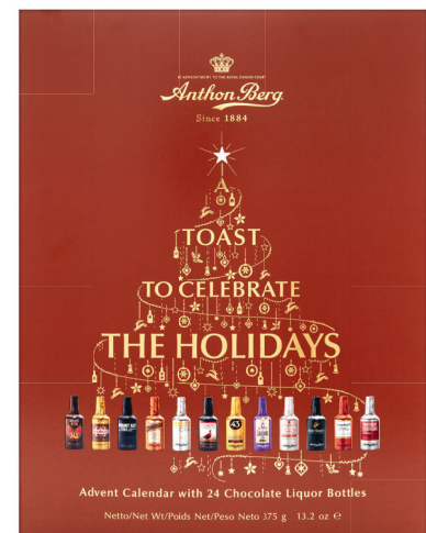
19.95 ANTHON BERG ADVENTSKALENDER LIKÖRSCHOKOLADEN 375 g (100 g = 5.32)