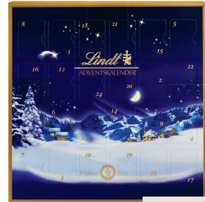
9.50 LINDT EXCELLENCE TISCH ADVENTSKALENDER 148 g (100 g = 6.42)