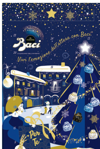
17.70 BACI ADVENTSKALENDER 278 g (100 g = 6.37)