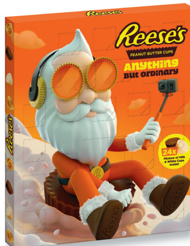
12.95 REESE'S ADVENTSKALENDER 245 g (100 g = 5.29)