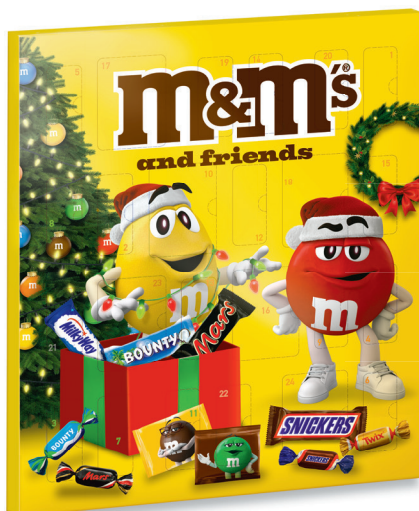
15.50 M&M'S & FRIENDS ADVENTSKALENDER 361 g (100 g = 4.30)