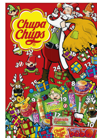
12.95 CHUPA CHUPS ADVENTSKALENDER 210,7 g (100 g = 6.15)