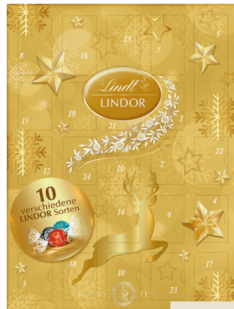
19.95 LINDT LINDOR ADVENTSKALENDER GOLDENER 290 g (100 g = 6.88)