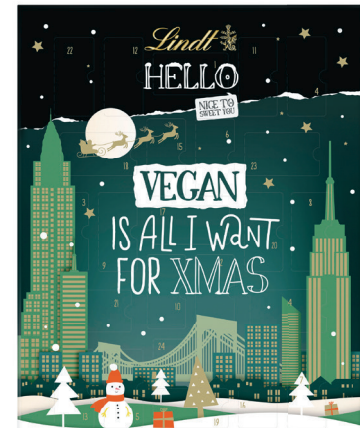
24.95 LINDT HELLO ADVENTSKALENDER VEGAN 228 g (100 g = 10.95)