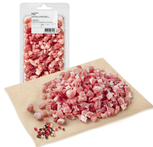
1.59 LARDONS FUMÉS Suisse / prix par 100g