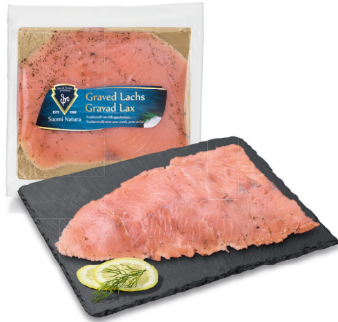
6.50 FILET DE SAUMON MARINÉ Norvège / 100 g