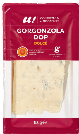
2.40 GORGONZOLA DOP U! 150 g (100 g = 1.60)