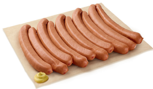
6.95 SAUCISSES DE VIENNE, 5 PAIRES* Suisse / 500 g (100 g = 1.39)