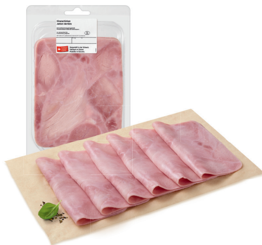
3.60 JAMBON DE DERRIÈRE Suisse / 200 g (100 g = 1.80)