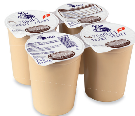
1.95 YOGOURT MOCCA TP 180 g (100 g = 1.10)