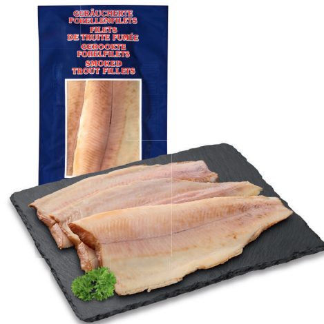
4.95 FILET DE TRUITE FUMÉE Danemark / 125 g (100 g = 3.96)