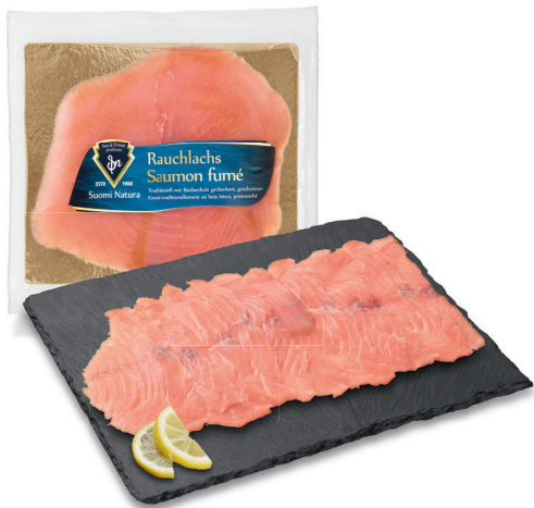
6.50 FILET DE SAUMON FUMÉ Norvège / 100 g