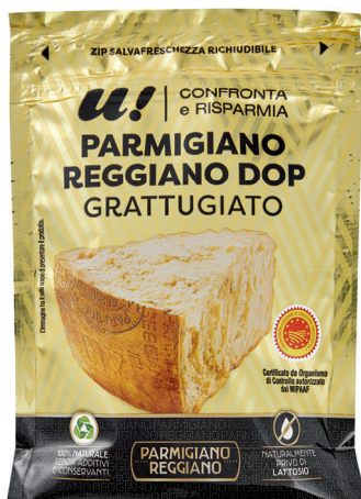
2.50 PARMIGIANO REGGIANO DOP RÂPÉ U! 100 g