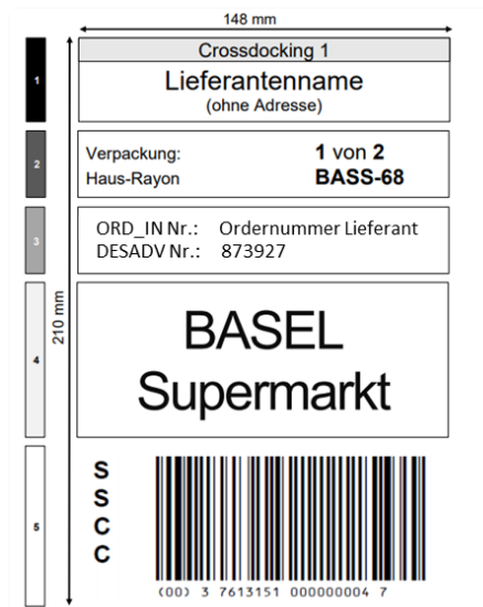
Illustration : Exemple d’affichage sur un support de transport